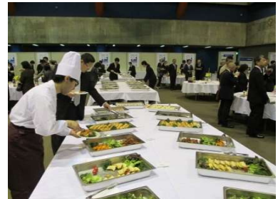
【福祉関係者の会ケータリング】 (300人規模)