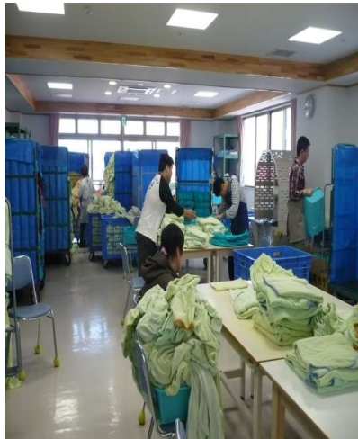
浴衣やタオルたたみ作業