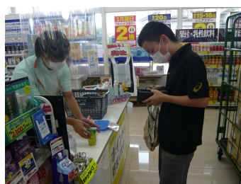
自立訓練(買物学習の様子)