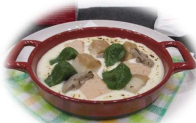
【魚沼産コシヒカリ 米粉のパングラタン】