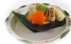
【長岡野菜と車麩の炊き合わせ】