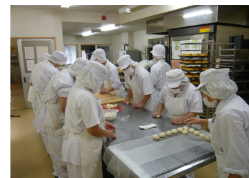
パン工房班作業風景

施設近隣の草取り、落ち葉掃き、よさこい演舞等を通じて地域の方々とふれあい、社会貢献活動を実施しています。