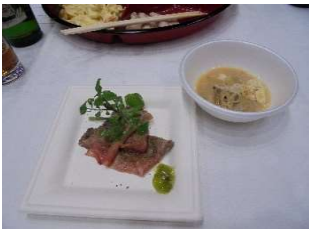
【50周年記念懇親会 アオーレ長岡】 和牛ローストビーフ(3銘柄)他提供