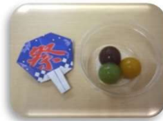
【尺玉ようかん】 片貝まつり