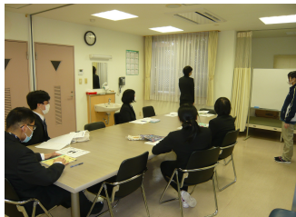
講習風景(施設内にて)

内容; 一般就労等への就労を希望する人に一定期間(24ヶ月)、事業所内や企業における作業や実習、適性に合った職場探しや、就労後の職場定着のための支援を行います。また、生産活動を通して職業訓練を行ないます。