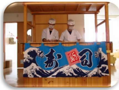
【屋台での寿司提供】