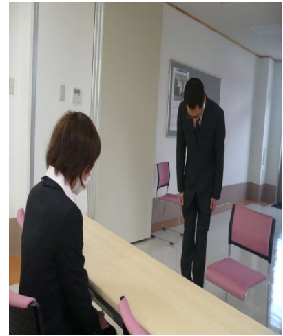
就職に向けた面接練習