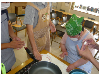
自立訓練(調理実習の様子)

内容; 自立した日常生活・社会生活ができるよう、一定期間(24ヶ月)、生産活動等とおして身体機能や生活能力の向上のために必要な訓練を行います。